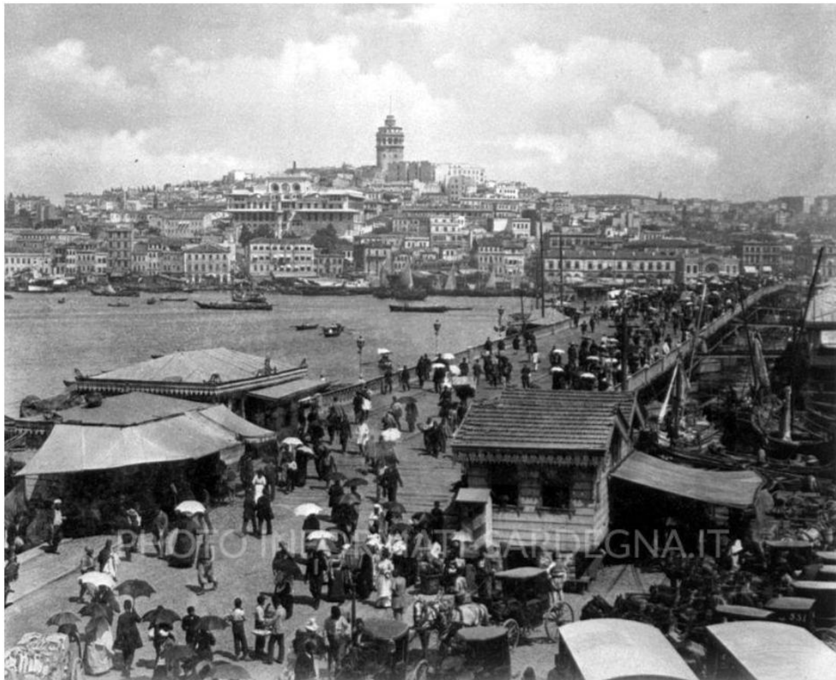
Il Ponte di Galata a Istanbul nella fine del XIX secolo. Foto: