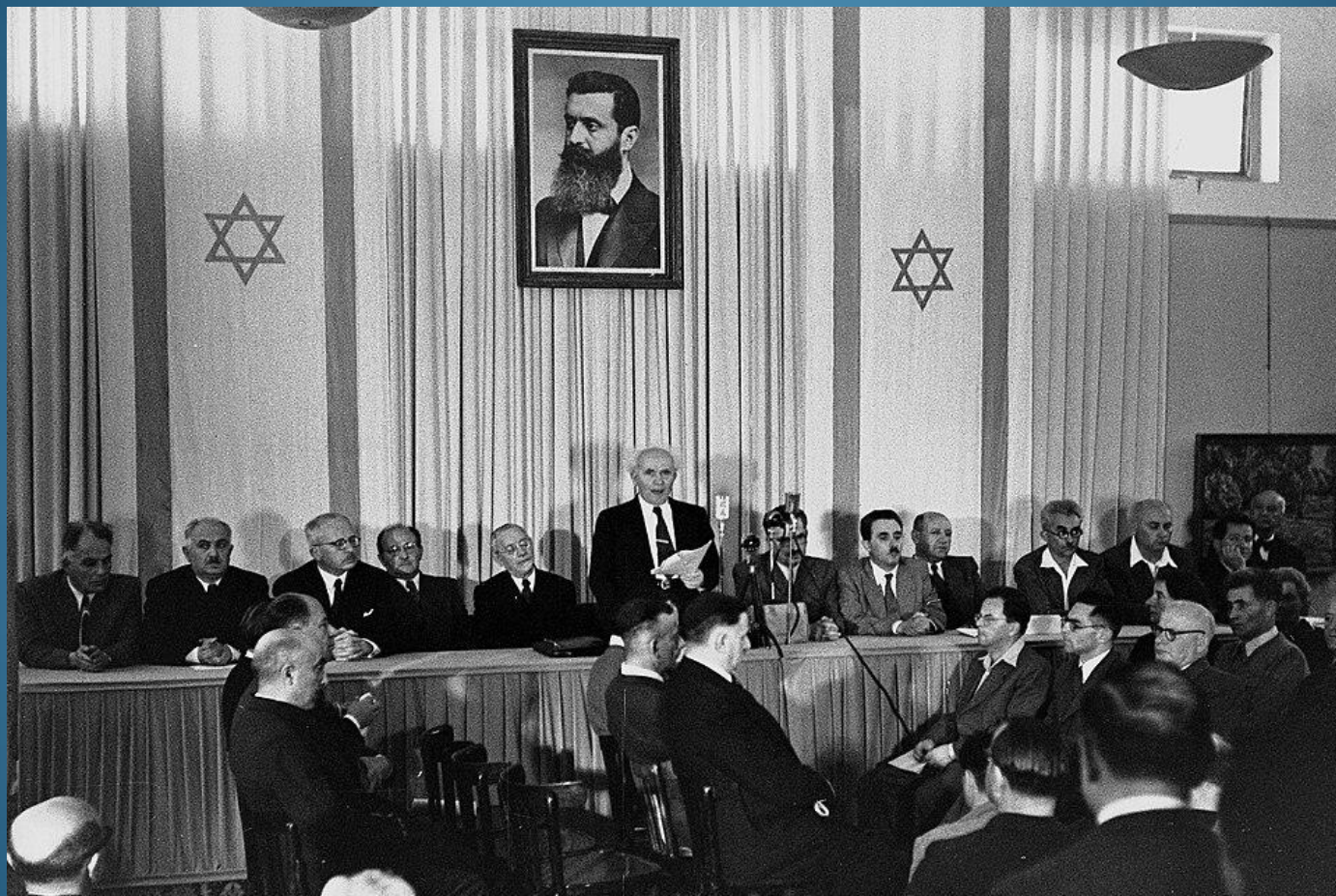
David Ben-Gurion (primo primo ministro di Israele) pronuncia pubblicamente la Dichiarazione dello Stato di Israele, 14 maggio 1948, Tel Aviv, Israele