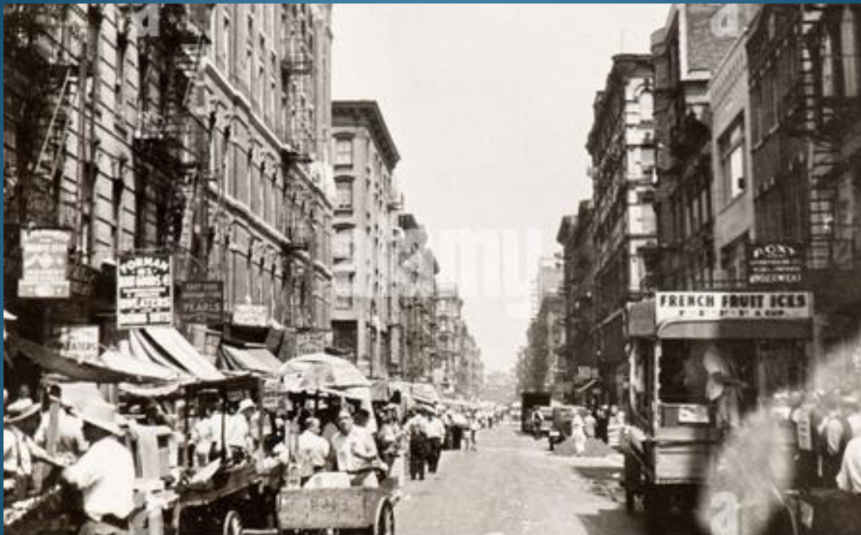
NEW YORK quartiere ebraico nel 1884