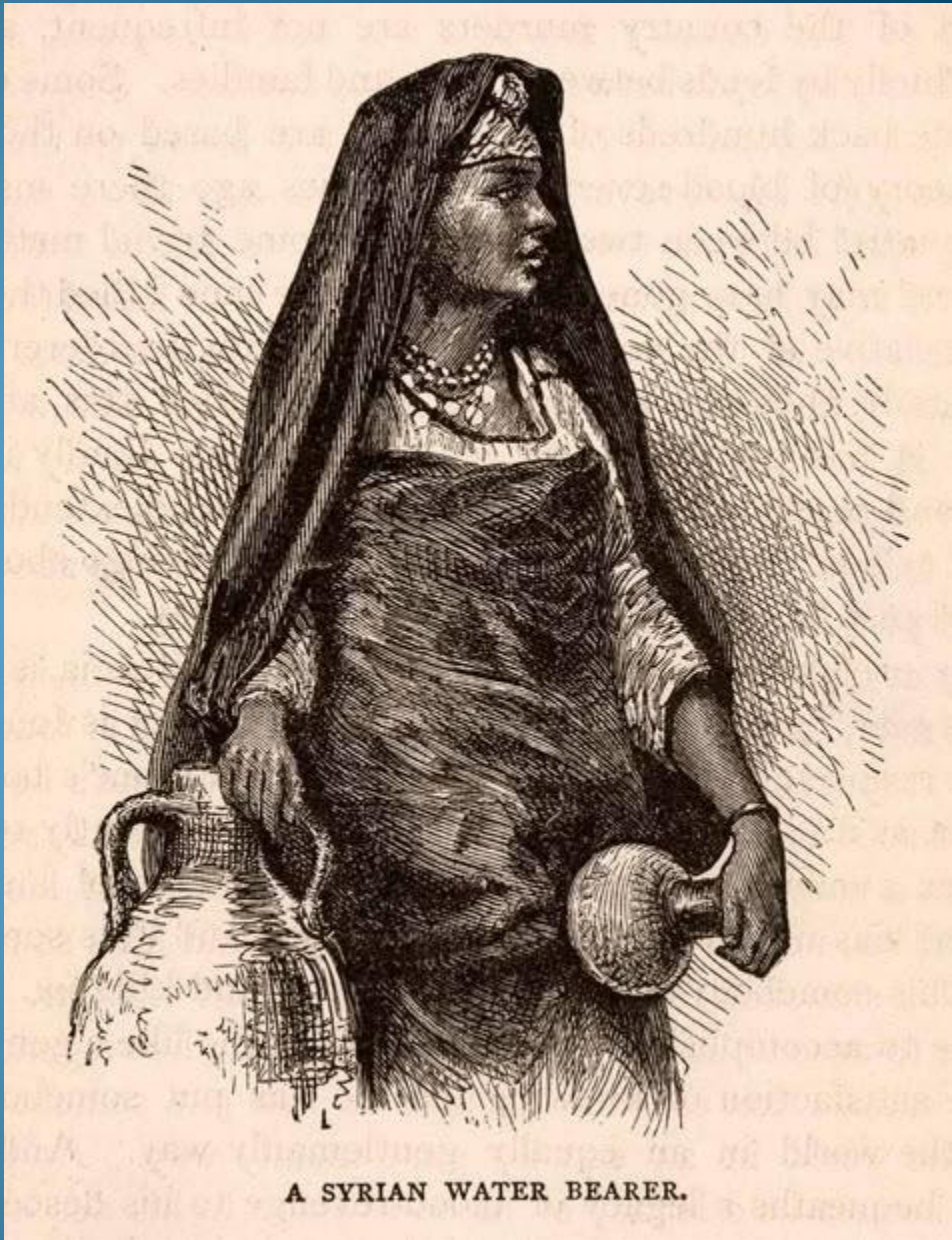
A SYRIAN WATER BEARER.