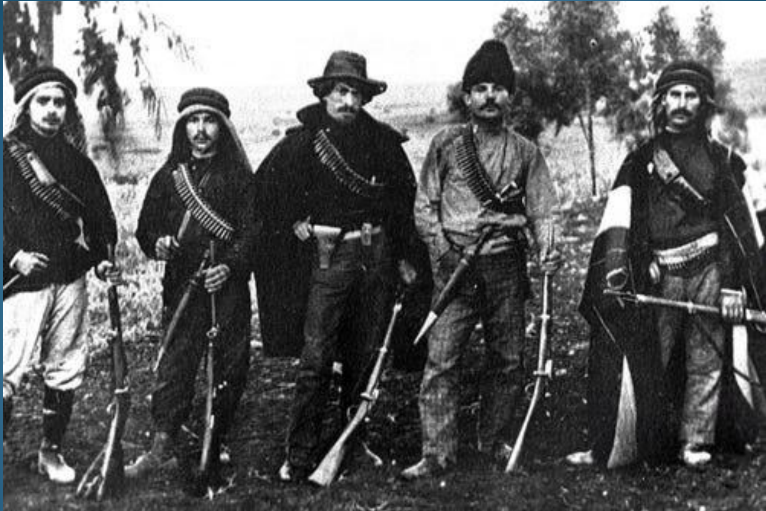
I membri dell'Hashomer, un'organizzazione di sicurezza ebraica dedita alla protezione degli insediamenti sionisti pionieristici, posano con i loro fucili il 1° ottobre 1907 nell'Alta Galilea durante il dominio ottomano della Palestina