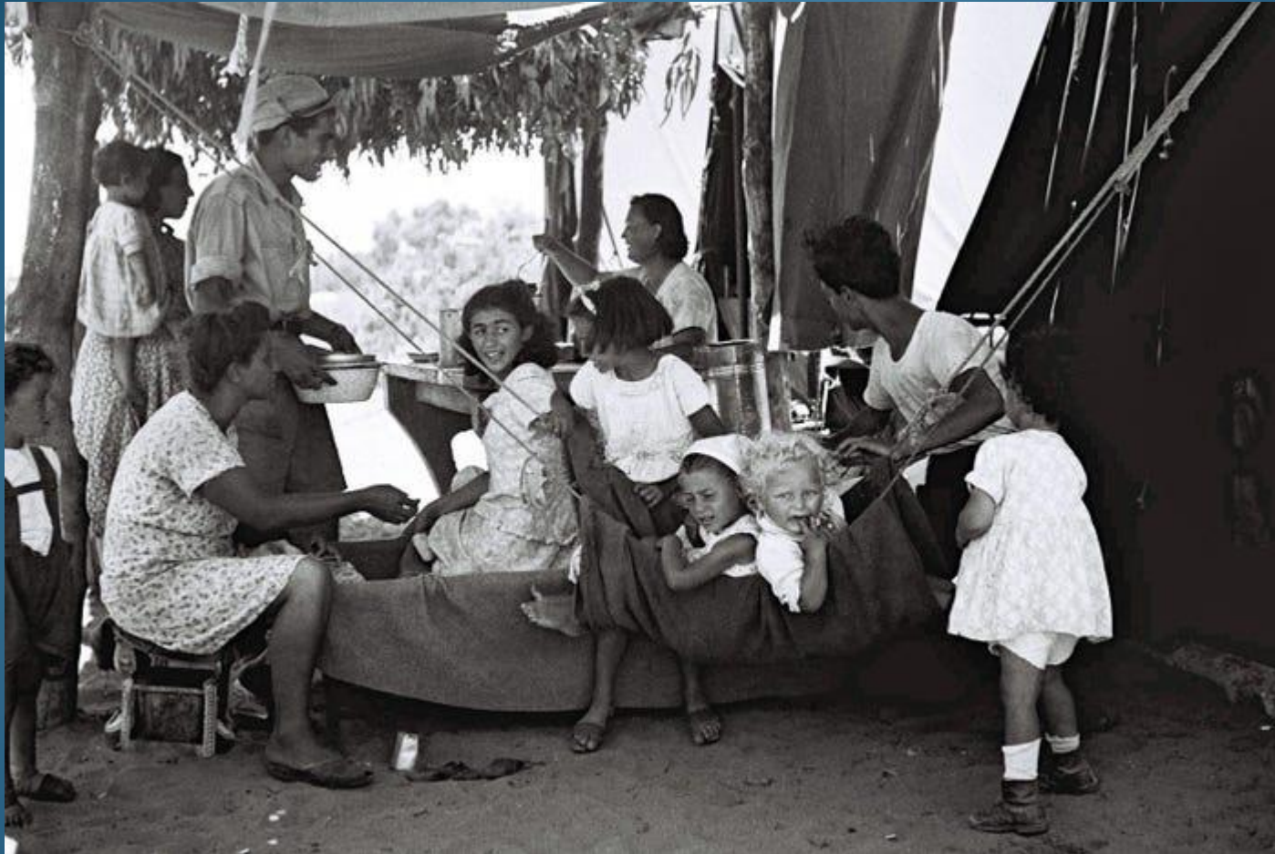
Una famiglia ebrea fuori dalla propria tenda nel nuovo campo per immigrati, il 1° dicembre 1949 a Beit Lid, nel neonato Stato di Israele.