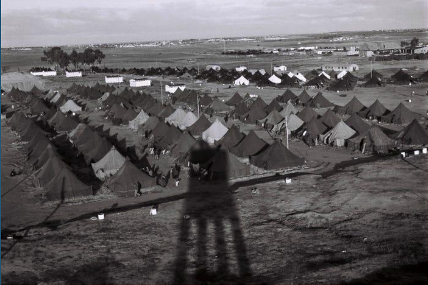
Una torre di guardia proietta una lunga ombra pomeridiana su un nuovo campo di immigrati, il 1° dicembre 1949 a Beit Lid, nel neonato Stato di Israele.