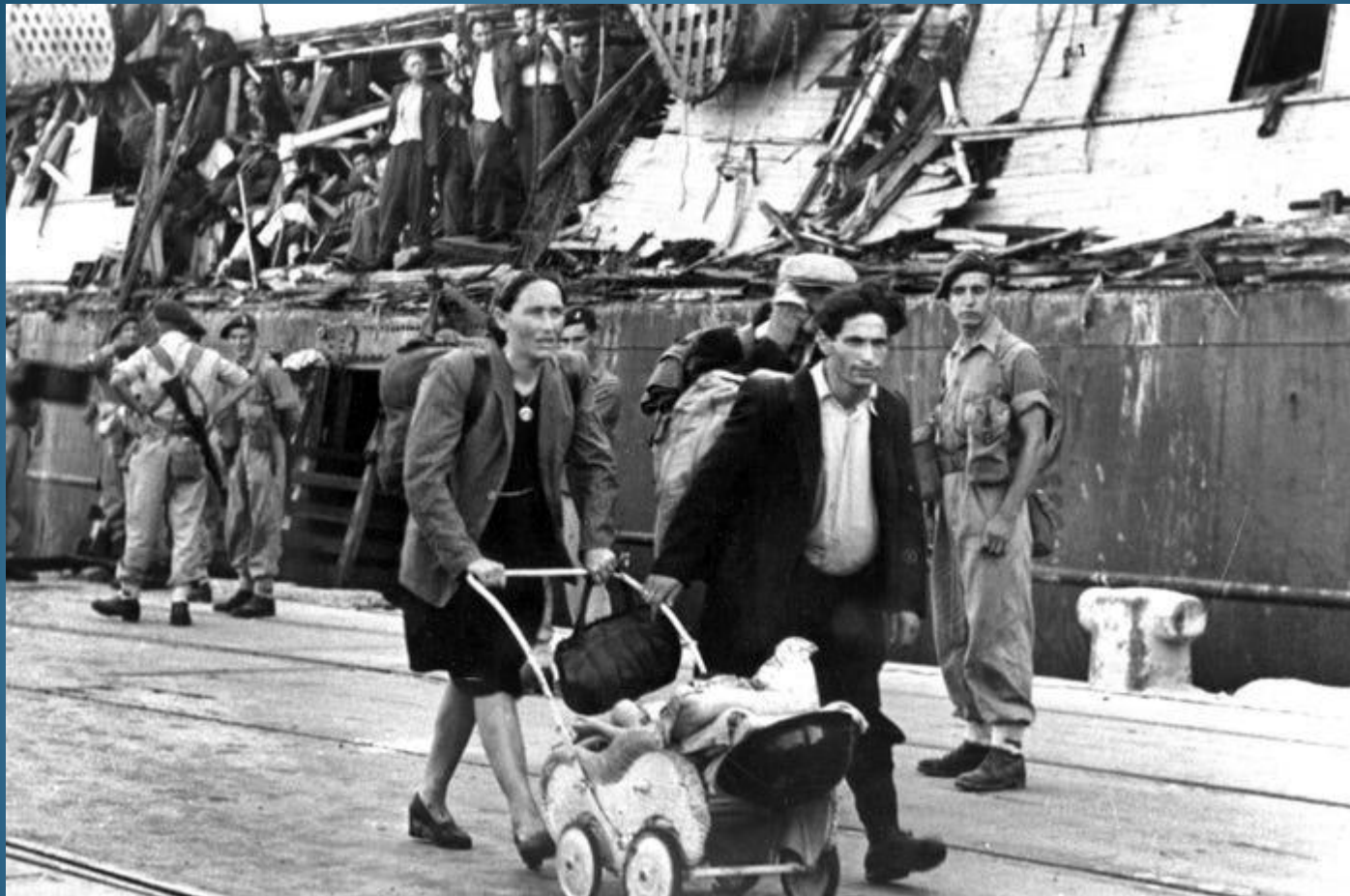
Le truppe britanniche osservano lo sbarco dei passeggeri dalla nave "Haganah Exodus 1947" il 1° giugno 1947 ad Haifa, durante il mandato britannico sulla Palestina.