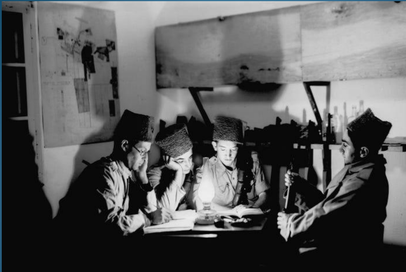
Coloni pionieri ebrei e membri del movimento di difesa pre-statale Haganah nel loro posto di guardia il 3 novembre 1938 nel kibbutz Givat Brenner.