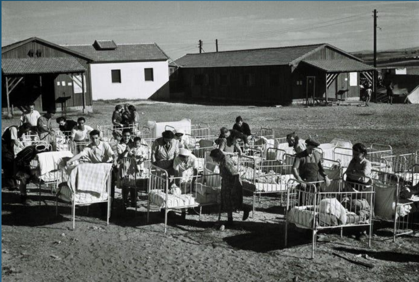
I nuovi immigrati ebrei portano i loro bambini fuori, sotto il caldo sole del campo per immigrati, il 1° dicembre 1947 a Rana'ana, durante il Mandato britannico della Palestina.