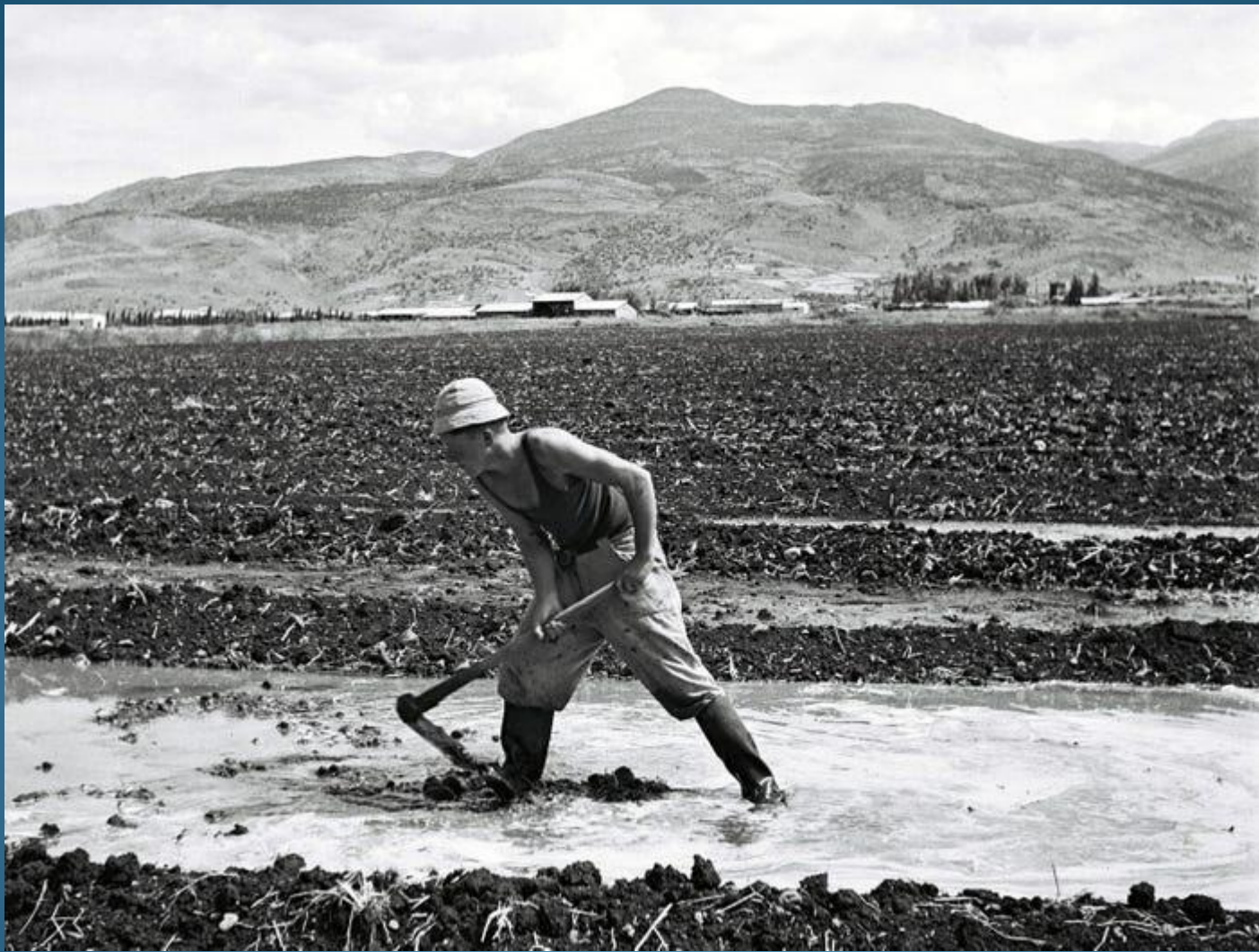
Un membro di questa comunità agricola pionieristica sionista irriga i campi il 1° giugno 1946 nel kibbutz Dan, durante il mandato britannico della Palestina.