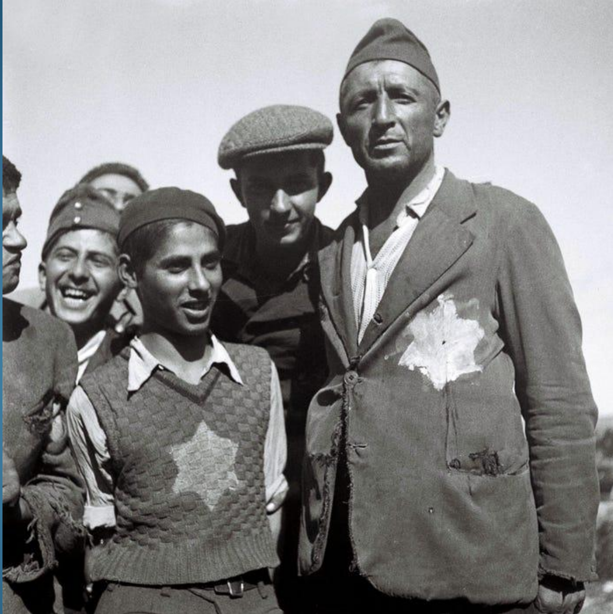
I sopravvissuti ebrei ai campi di STERMINIO nazisti in Europa portano ancora i segni del loro calvario sui loro abiti laceri nel campo di accoglienza per nuovi immigrati ad Atlit, il 4 novembre 1944, durante il mandato britannico della Palestina.