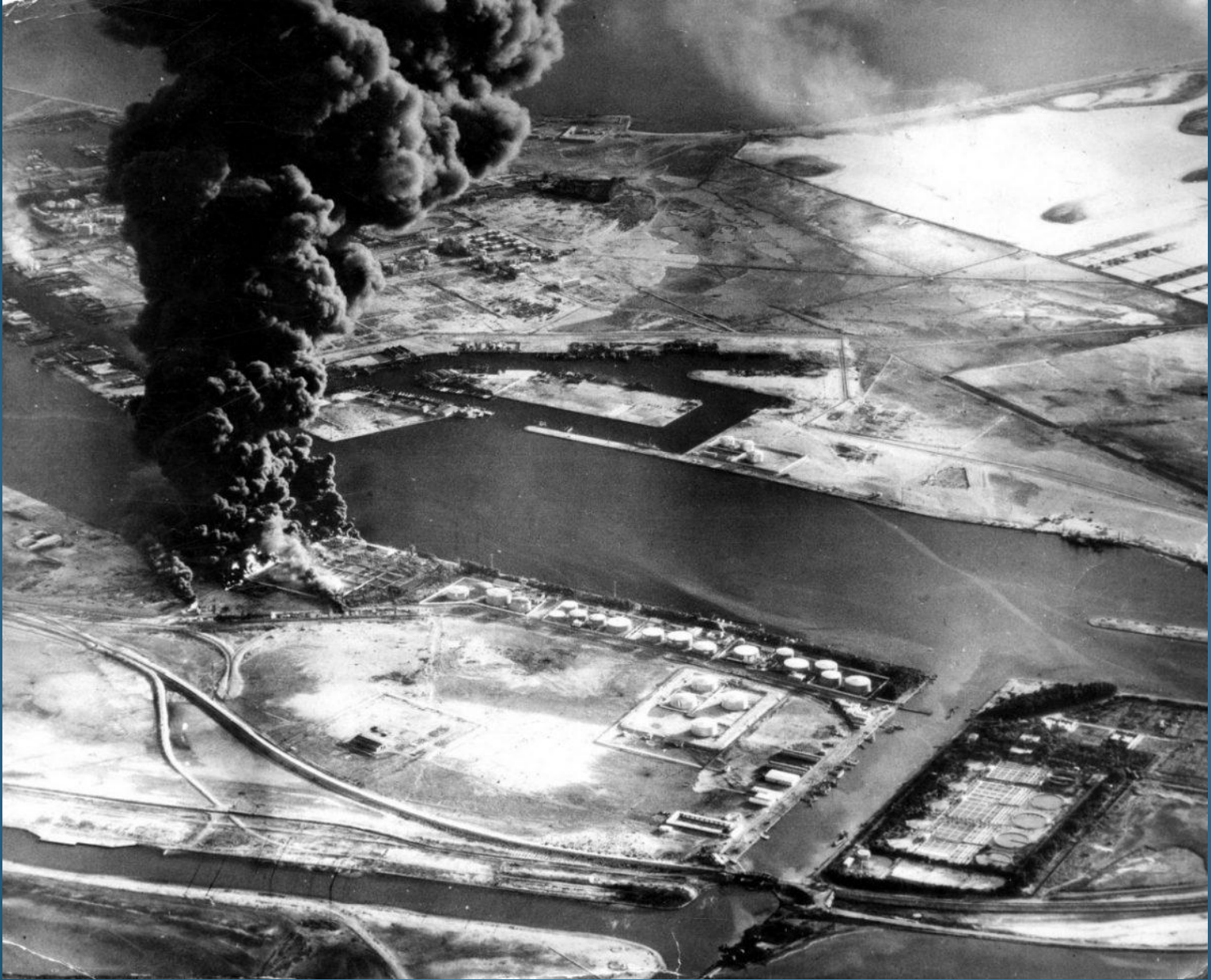
Effetti di un attacco aereo israeliano contro il canale