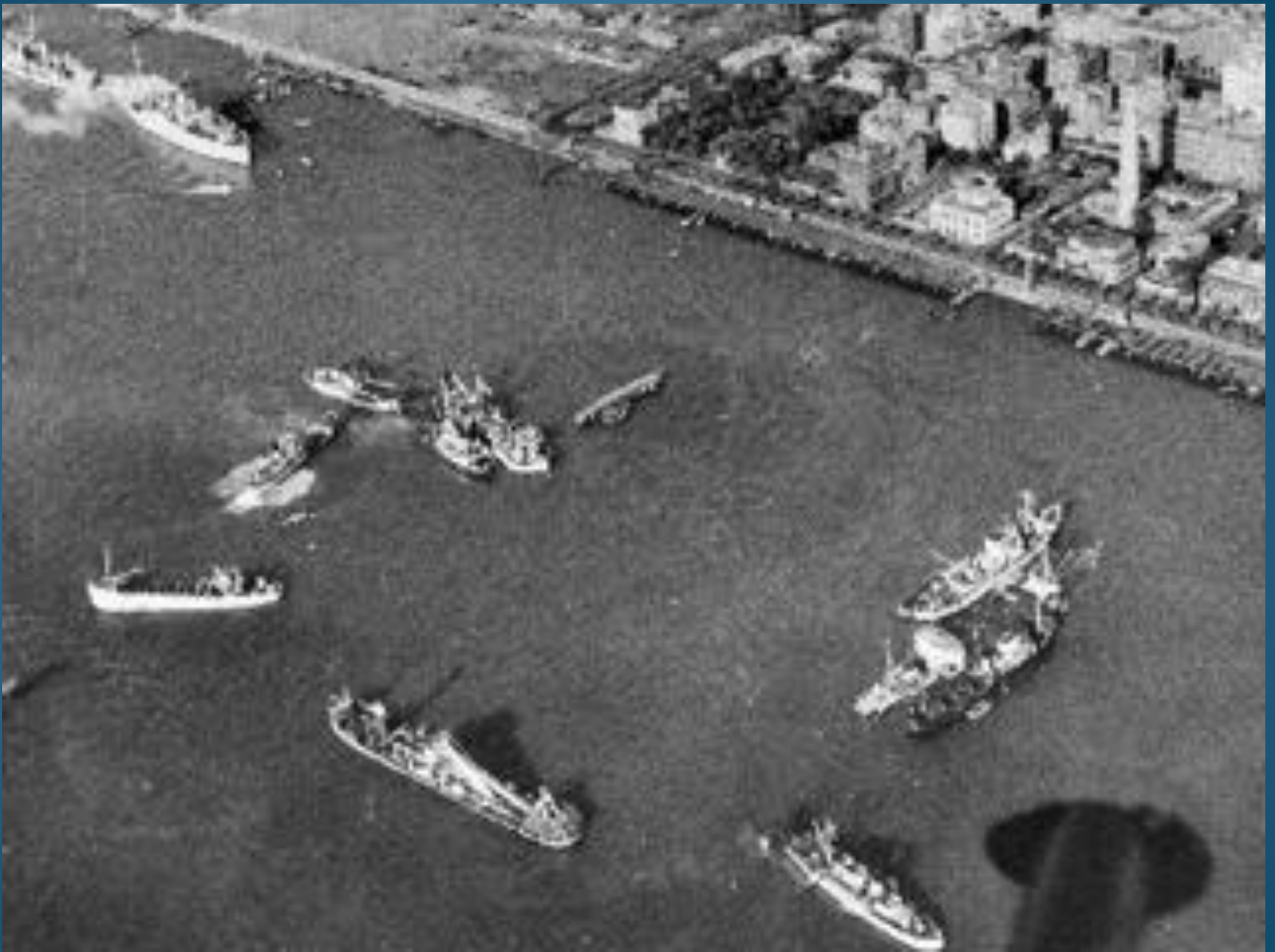
Navi affondate dagli egiziani per rendere intransitabile il canale di Suez