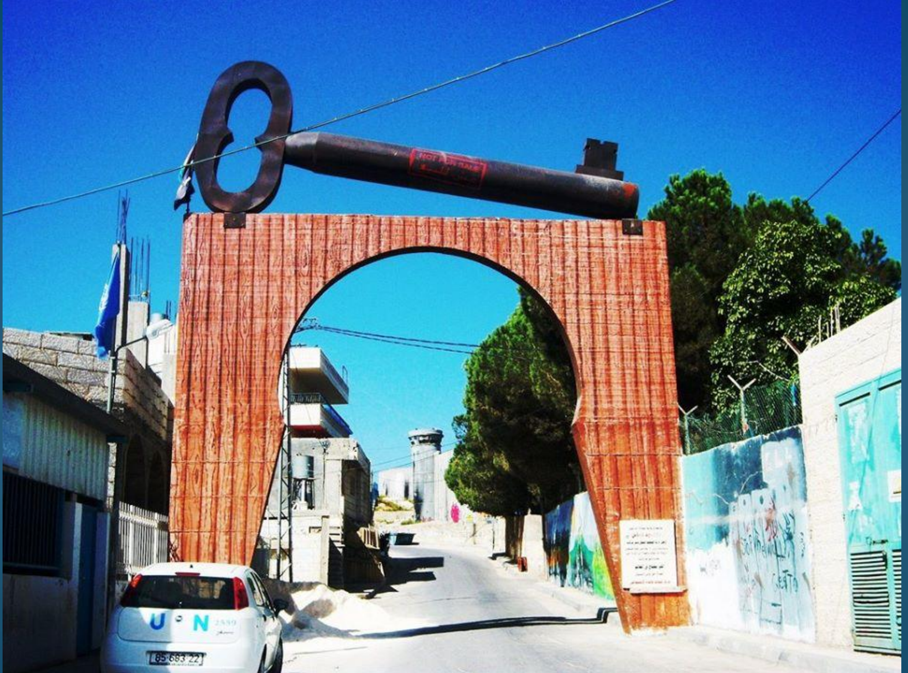
L'ingresso del campo profughi palestinese di Aida (Betlemme)