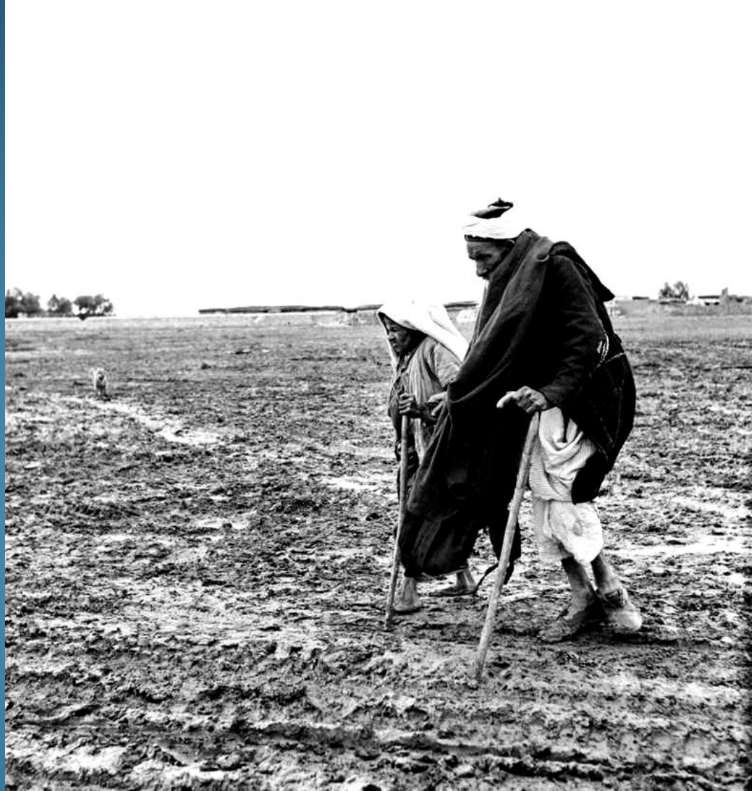
Palestinesi in fuga nel 1948