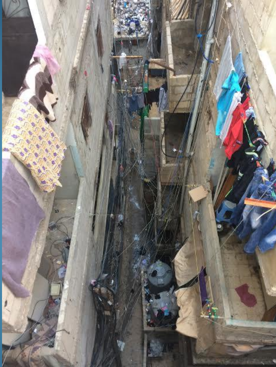
Beirut. Campo profughi palestinese di Shatila