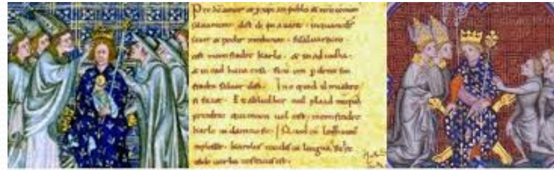
Charles le Chauve